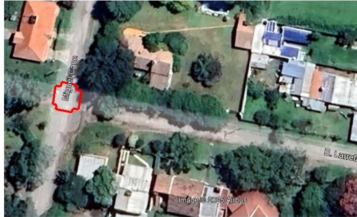
Bocacalle cane y Larreta

Los niveles a respetar deberán tomarse desde el adoquín de calle Castilla hasta el puente del canal innominado debiendo realizar a la altura del arroyo un canal que unirá la cuneta con el cauce del innominado.