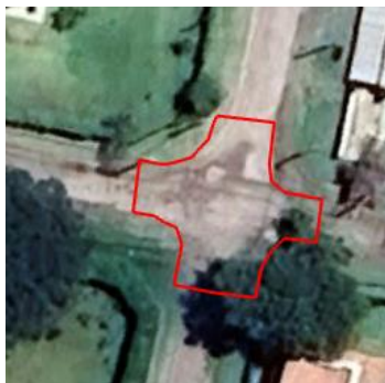
Bocacalle Belisario Roldán e Italia

SE DEBERA TENER EN CUENTA QUE LOS DESAGUES PLUVIALES DOMICILIARIOS DESEMBOQUEN SOBRE LA CUNETA Y SE DEBERA REALIZAR EN HORMIGON UN CORDÓN DE PROTECCION SOBRE LOS MISMOS PARA EVITAR QUE SE ROMPAN CON EL PASO LOS VEHICULOS