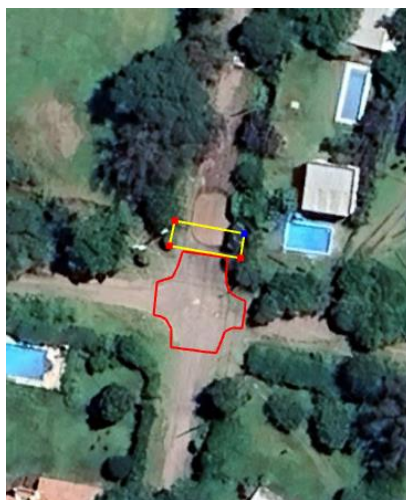
Bocacalle Miguel Cané y Oscar Wilde y Badén

Los niveles a respetar deberán tomarse desde el adoquín de calle Castilla hasta el puente del canal innominado debiendo realizar a la altura del arroyo un canal que unirá la cuneta con el cauce del innominado.